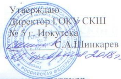
График проведения родительского патруля.